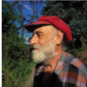
Friedensreich Hundertwasser, österreichischer Künstler (1928-2000)

Ergänzen Sie die richtige Form des Verbs und bei Bedarf auch das Reflexivpronomen.